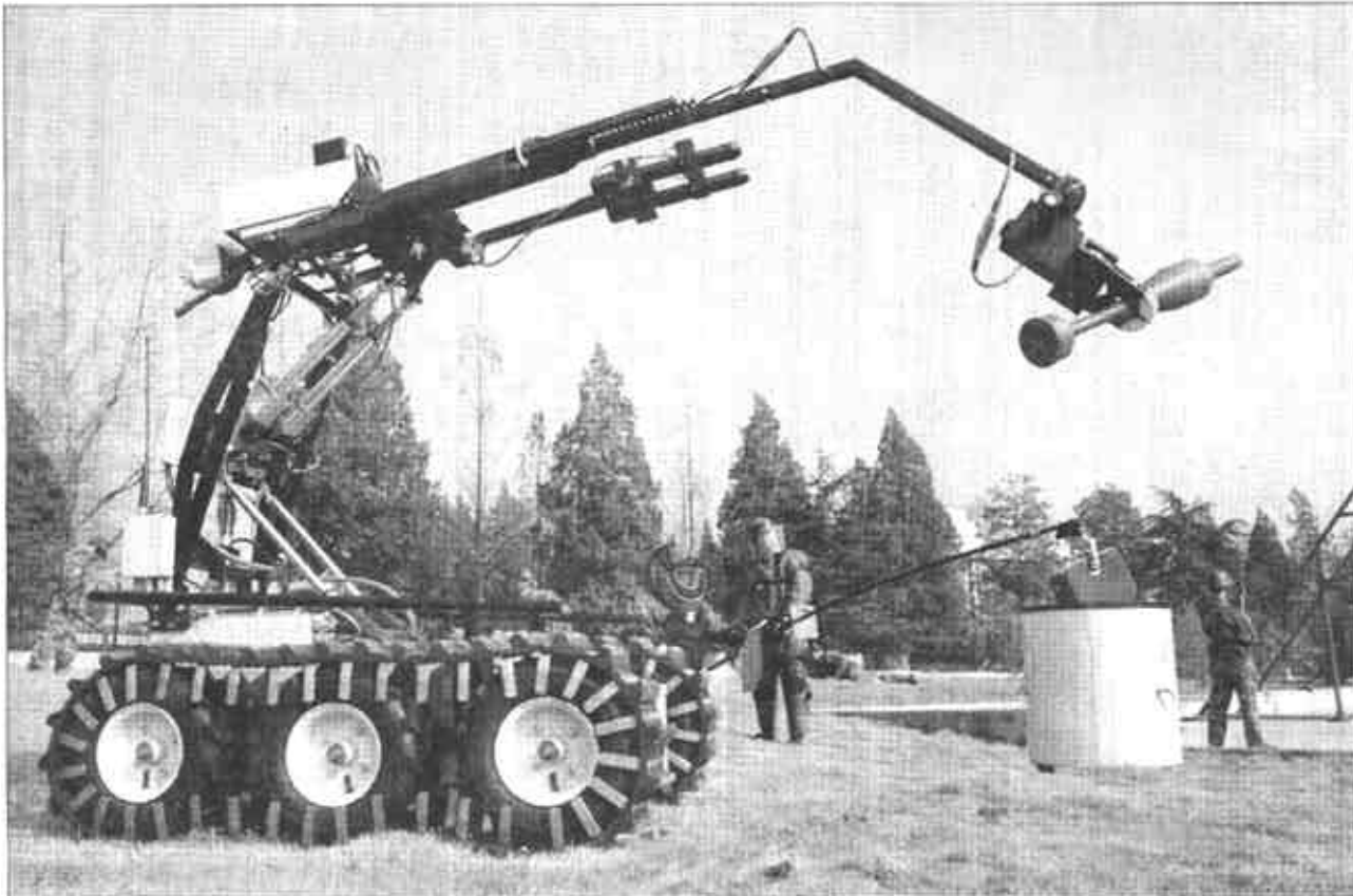
12月18日,我军首期反恐工程兵技术集训班在南京解放军理工大学工程兵工程学院结业。由总参军训和兵种部组织举办的全军反恐工程兵技术集训,紧紧围绕工程兵部队在反恐军事斗争中的反爆炸、工程支援和抢险救援三大任务施教,进一步提高了我军工程兵反恐专业应急能力。这是大型排爆机器人正在进行排爆作业演示。

(上接第一版)(五)切实维护社会稳定,加快推进“平安东营”建设。牢固树立维护稳定就是推进发展,就是维护人民群众利益的指导思想,善于从全国大局着眼,从本地实际入手,探索建立各级干部、政法队伍、广大群众齐抓共管的工作格局和维护稳定的长效机制,全面推进“平安东营”建设。要加强组织领导,强化基层基础工作,完善矛盾纠纷排查调处机制,贯彻“严打”经常性工作机制。高度重视安全生产,加强监督管理,努力消除事故隐患,确保不发生重大安全生产事故。