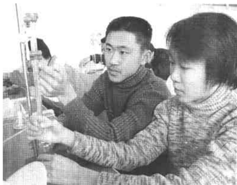
利津一中坚持素质教育，鼓励学生自己动手，进行科学实验，开发他们的智力。近日，在山东省普及实验教育检查验收中，以990分全省高中学业最高分通过检查验收。