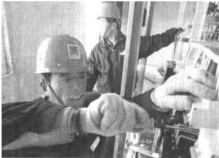
“引”客商安家落户是垦利县永安供电所配合当地政府实施招商引资的新举措，他们主动上门、承诺服务。日前，已为16家外来企业安装了配套用电设备。